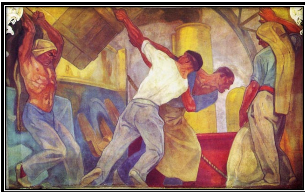
“Los descargadores”, Aurelio Arteta (1921/1923)

Sevilla, 16 y 17 de abril de 2026 Facultad de Derecho de la Universidad de Sevilla - Salón de Grados